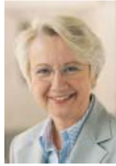
Prof. Dr. E. Jürgen Zöllner Präsident der Kultusministerkonferenz 2007

Das Programm für lebenslanges Lernen macht Europa erfahrbar – ganz in der doppelten Bedeutung des Worts. Ich würde mir wünschen, dass möglichst viele Bürgerinnen und Bürger in Europa von der Mobilität und den neuen Wegen in der Zusammenarbeit profitieren.